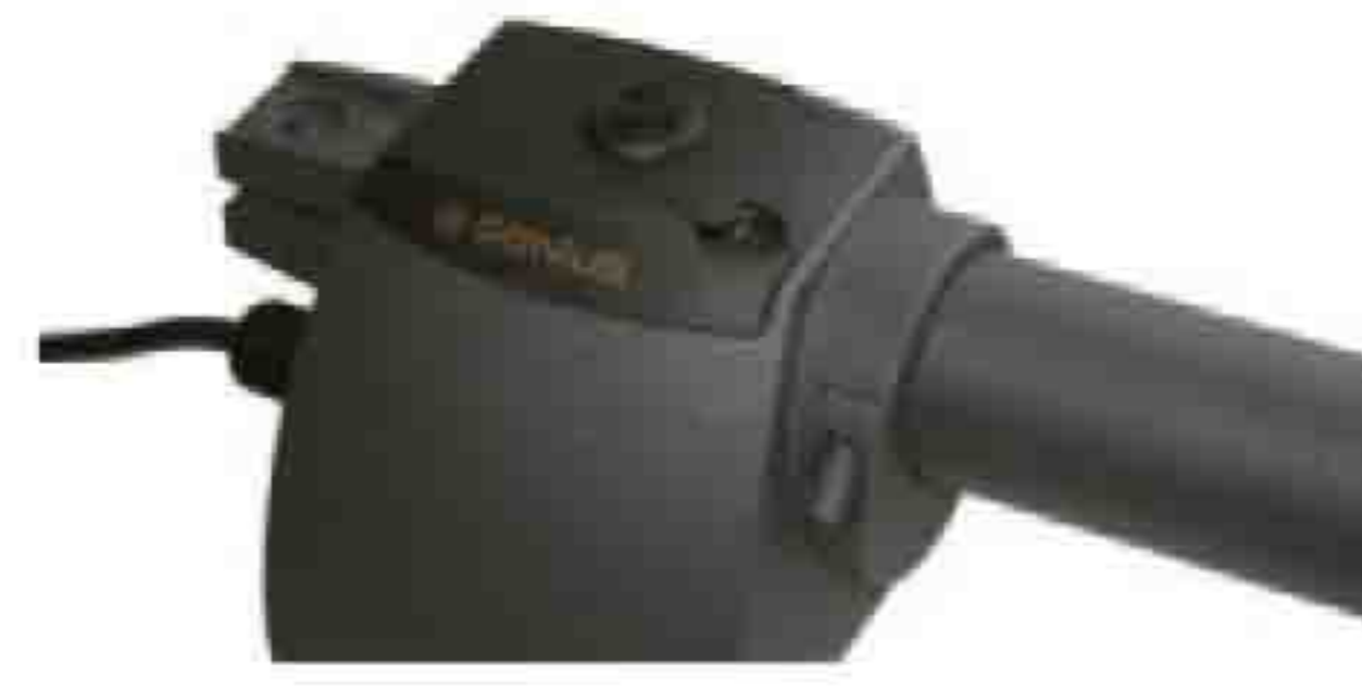
Entrada de llave