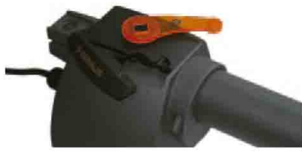
Llave de desbloqueo