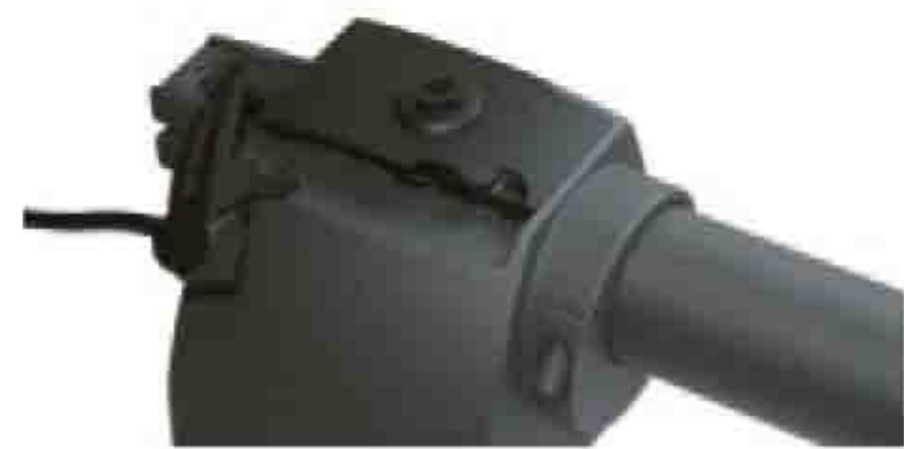
Palanca de desbloqueo manual

Sistema de desbloqueo confiable y seguro para el usuario del equipo